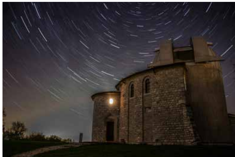
Pohvala / Elogio