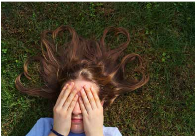
Pohvala / Elogio