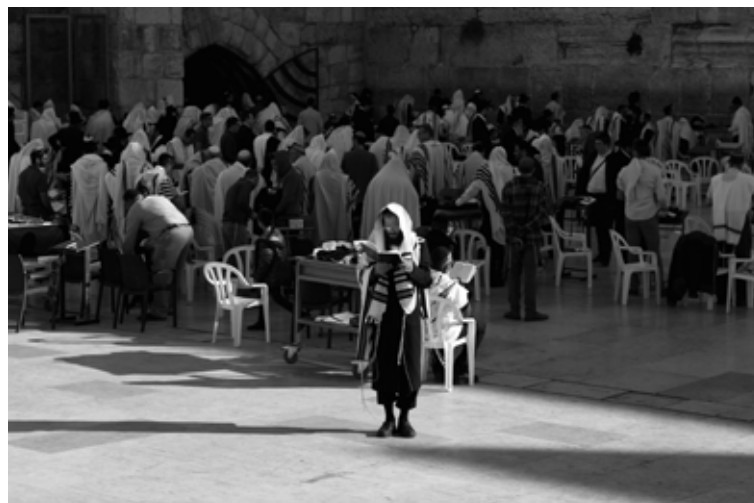
Pohvala / Elogio