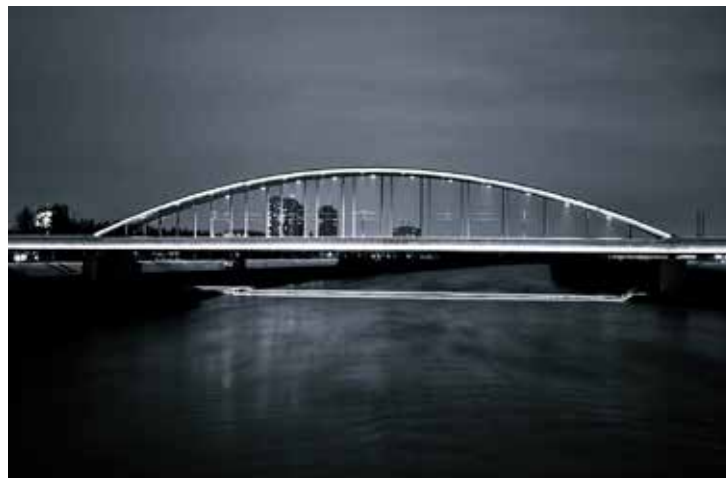
Pohvala / Elogio