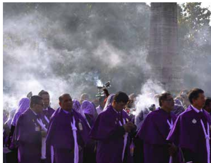
Pohvala / Elogio