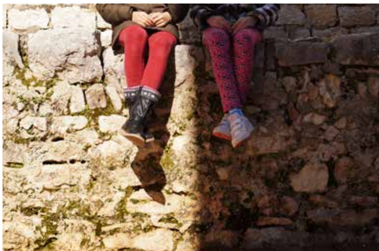
Pohvala / Elogio